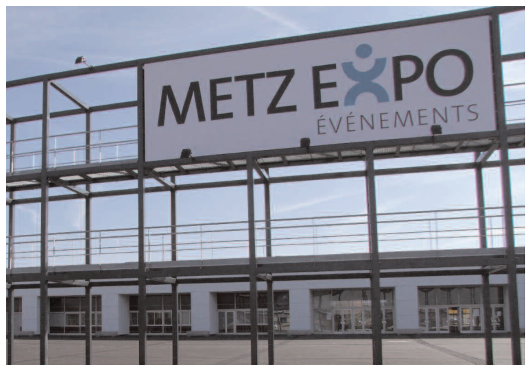
vue façade Hall C